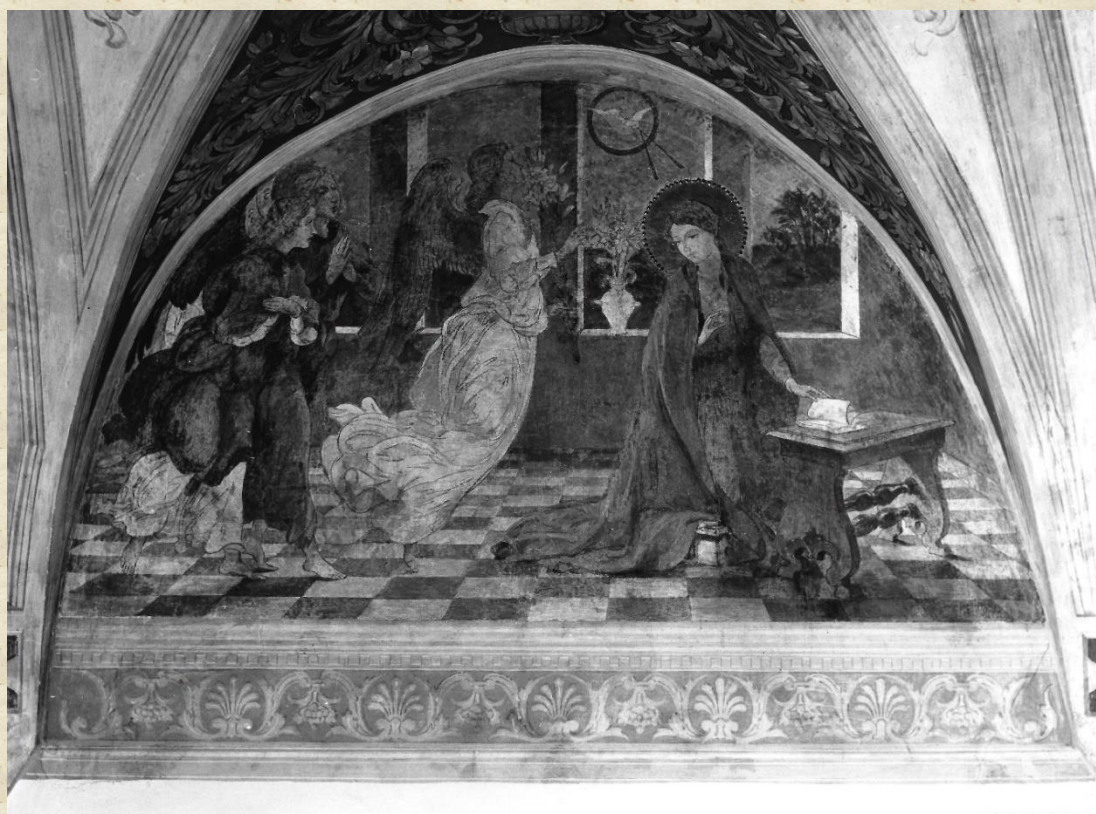
L'Annunciazione prima e dopo il restauro