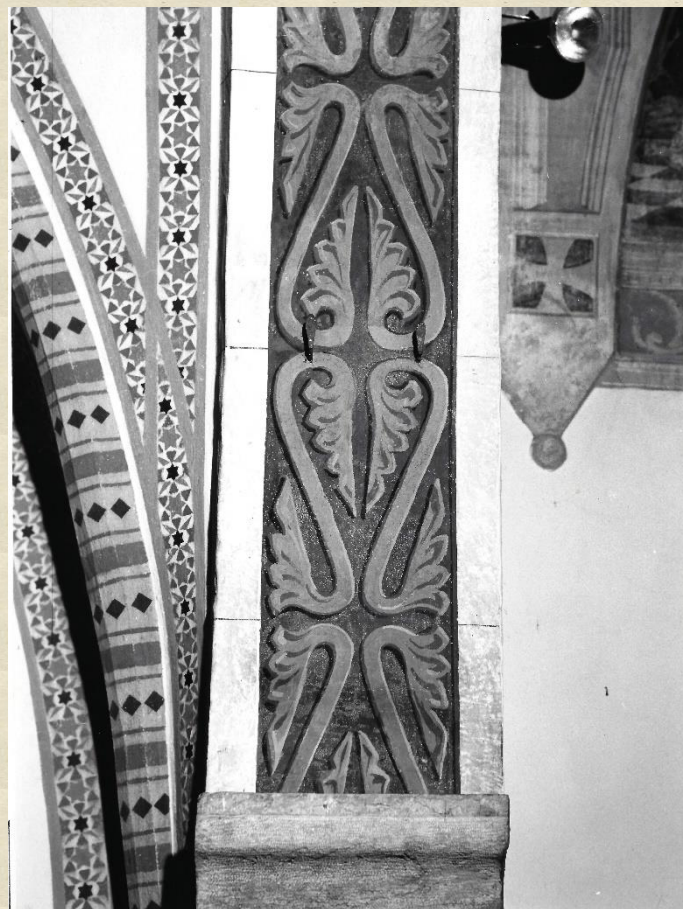
I fregi dell'arco santo e della navata quasi scomparsi prima del restauro ravvivati dopo il restauro